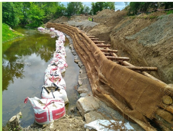
Restauration des berges de la Bouble à Bayet