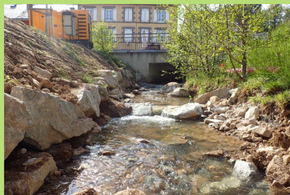
Ruisseau de Cubes dans le bourg de Châteauneuf-les-Bains

Le Contrat Territorial Sioule entre dans sa dernière phase de réalisation. L'étude bilan est en cours. Le SMAD des Combrailles et l'animateur du CT réalisent actuellement, et ce jusqu'à l'automne, les diagnostics des cours d'eau prioritaires pour la future programmation. Le bilan technique et financier a également débuté.