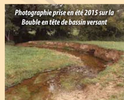
Photographie prise en été 2015 sur la Boule en tête de bassin versant