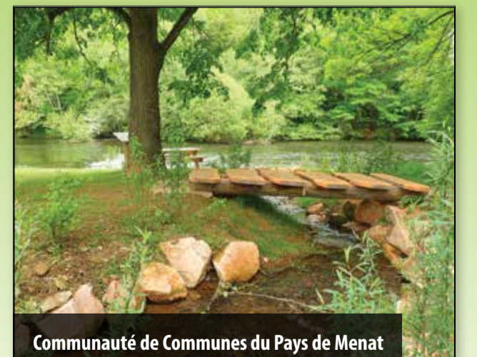
Communauté de Communes du Pays de Menat

La plupart des centres-bourgs du bassin versant sont désormais raccordés à une unité de traitements des rejets domestiques. Mais, certains "points noirs" restent présents notamment dans la partie amont du bassin avec des conséquences particulièrement visibles en été sur la retenue des Fades-Besserves qui se traduit par des développements anormaux d'algues bleues. Afin de participer à l'amélioration de la qualité des eaux, la commune de Chapdes-Beaufort a finalisé en 2015 la construction d'une station d'épuration pour les villages des Girauds et de l'Etreille.