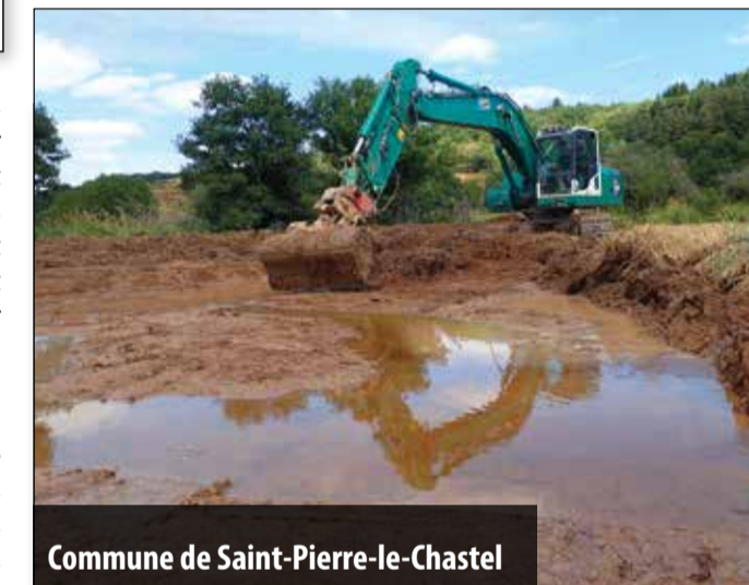
Commune de Saint-Pierre-le-Chastel

Dans ce cadre, deux mares de différente taille ont été créées afin de rendre le site plus attractif et plus attrayant pour un grand nombre d'espèces notamment d'oiseaux. Ces mares ne sont pas de simples "trous" creusés dans le marais, elles possèdent une forme asymétrique avec des contours irréguliers et des variations de profondeurs importantes. Cette configuration permet d'apporter un maximum de diversité d'habitats.