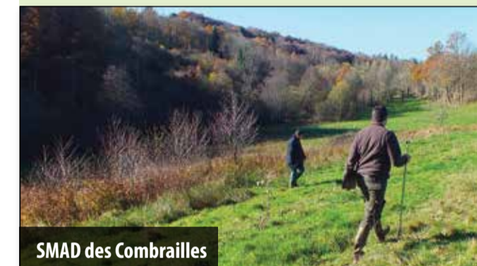
SMAD des Combrailles

Suivez l'avancement de cette mission d'inventaire sur www.riviere-sioule.fr (page d'accueil).