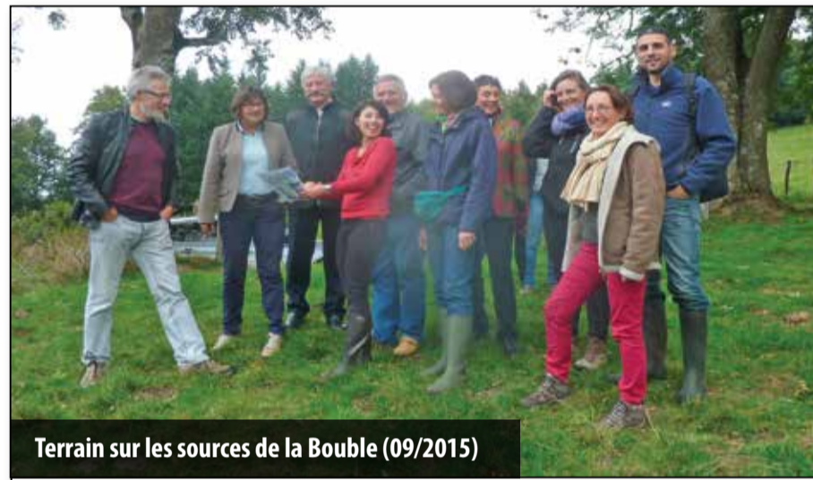
Terrain sur les sources de la Bouble (09/2015)

Les participants ont descendu la Bouble depuis sa source jusqu'à Saint-Eloy-les-Mines et ainsi constaté les effets de la sécheresse estivale et des atteintes portées à la rivière par négligence ou méconnaissance.