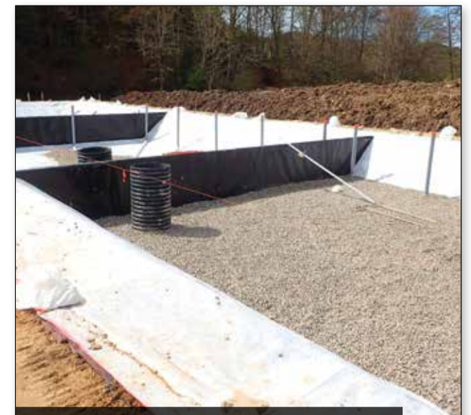
Commune de Chapdes-Beaufort / STEP Les Girauds

RESTAURATION ET DE VALORISATION DU MARAIS DE PALOUX CRÉATION DE MARES